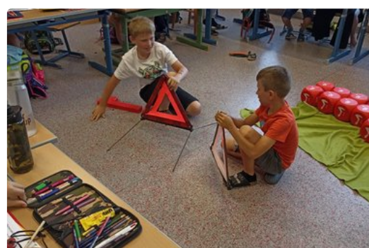
"Erste Hilfe FIT"

Unsere SchülerInnen lernen in Notsituationen schnell und angemessen handeln.