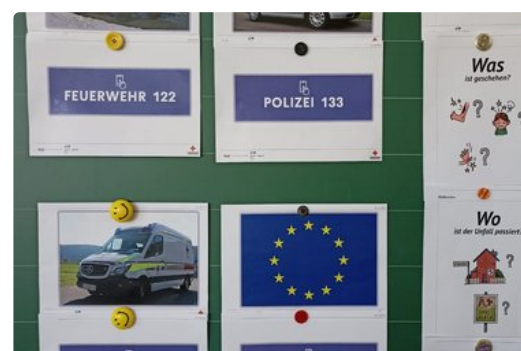
Grundlagenwissen rund um die Erste Hilfe und Wiederbelebung